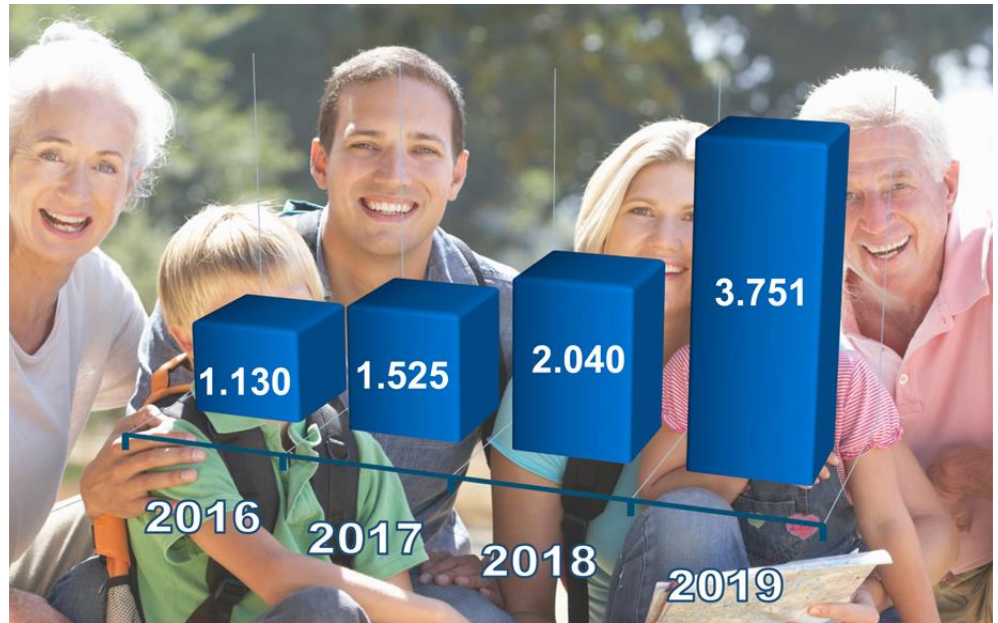
Entwicklung der BBG-Hilfeleistungen in Stunden