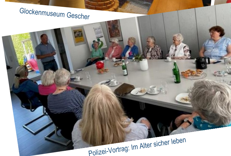
Polizei-Vortrag: Im Alter sicher leben