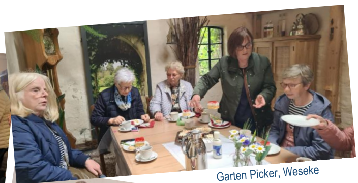
Garten Picker, Weseke