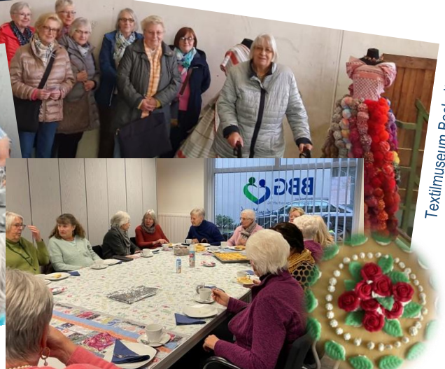
Kaffeetafel mit Selbstgebackenem